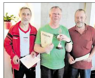
Bei der Überreichung der Siegerpokale werden die Sportler für ihre Leistungen belohnt.